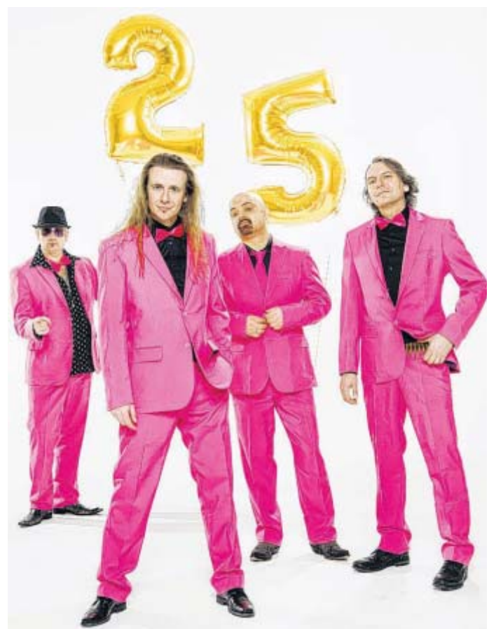
Seit 25 Jahren auf der Bühne: Zu diesem Anlass gibt's im Capitol Songs vom neuen Album „Nur die Besten werden alt!“ zu hören.

■ Paderborn. Bei der Oktober-Ausgabe der Midlife-Disco in der Kulturwerkstatt legen die DJs Atilla & Stefaan auf. Beginn am Freitag, 10. Oktober, ist um 21 Uhr. Eintritt: 5 Euro.