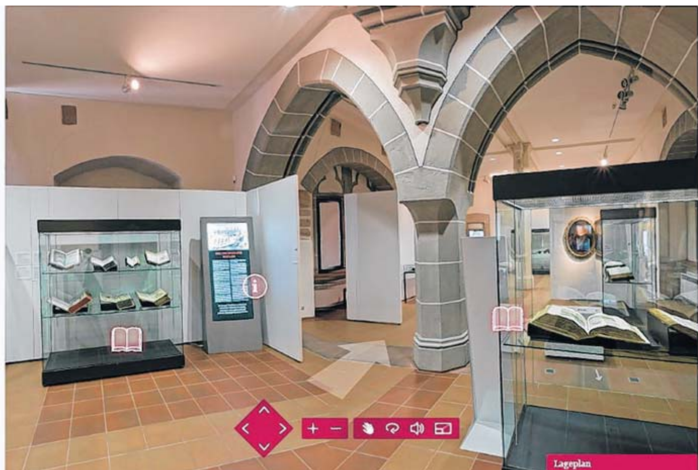
Ausstellung mal anders: Die Zeugnisse der Klostergeschichte werden Interessierten nun auch unabhängig von Öffnungszeiten und Ort im Internet zugänglich gemacht. GESTALTUNG: SISTERS OF DESIGN, HALLE/SAALE. PROGRAMMIERUNG: LENZ KD, HALLE/SAALE